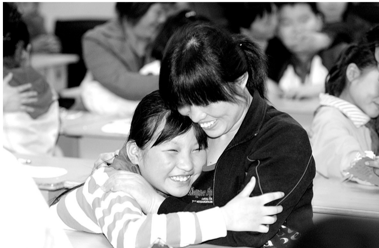
一名女生和妈妈紧紧拥抱。