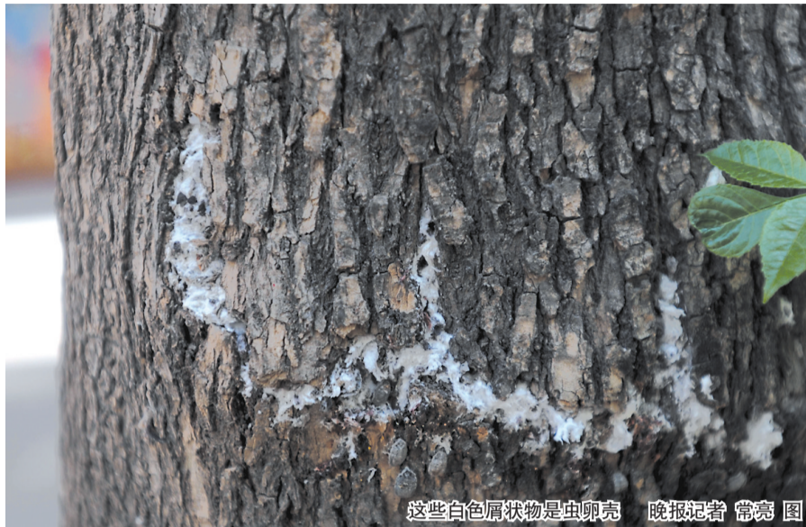
这些白色屑状物是虫卵壳

它们是3月底开始出现的,经常从树上突然掉下来,把路人吓了一跳。你看它,它却一动不动,跟死了一样。