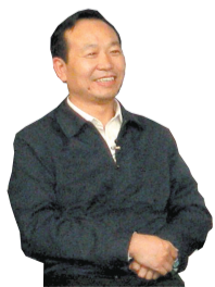
余遂盈 郑州市城市管理局局长