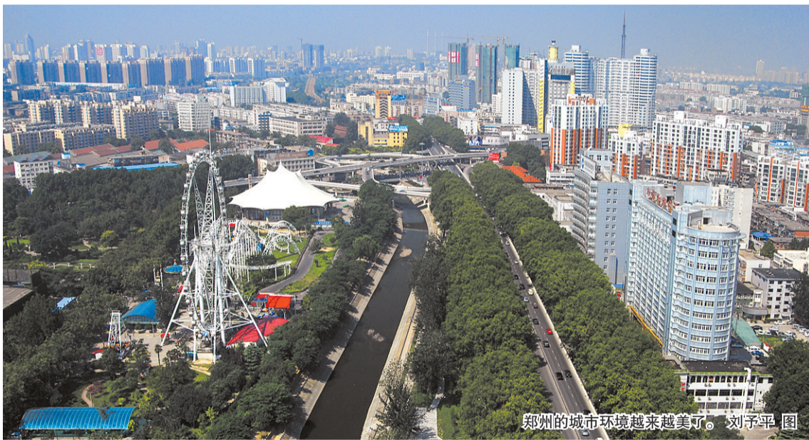
郑州的城市环境越来越美了。