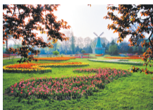
人民公园见证了郑州园林的变化