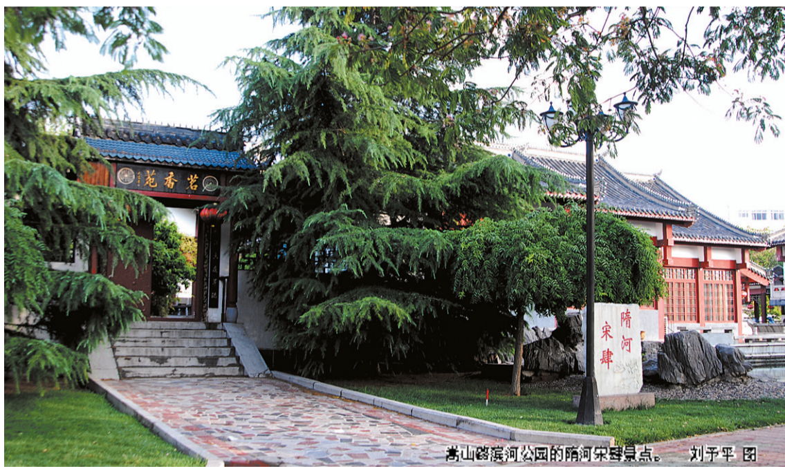
嵩山路滨河公园的隋唐宋遗址。

2006年12月14日 市十二届人大常委会第三十二次会议审议通过,正式命名悬铃木(法桐)为郑州市市树。