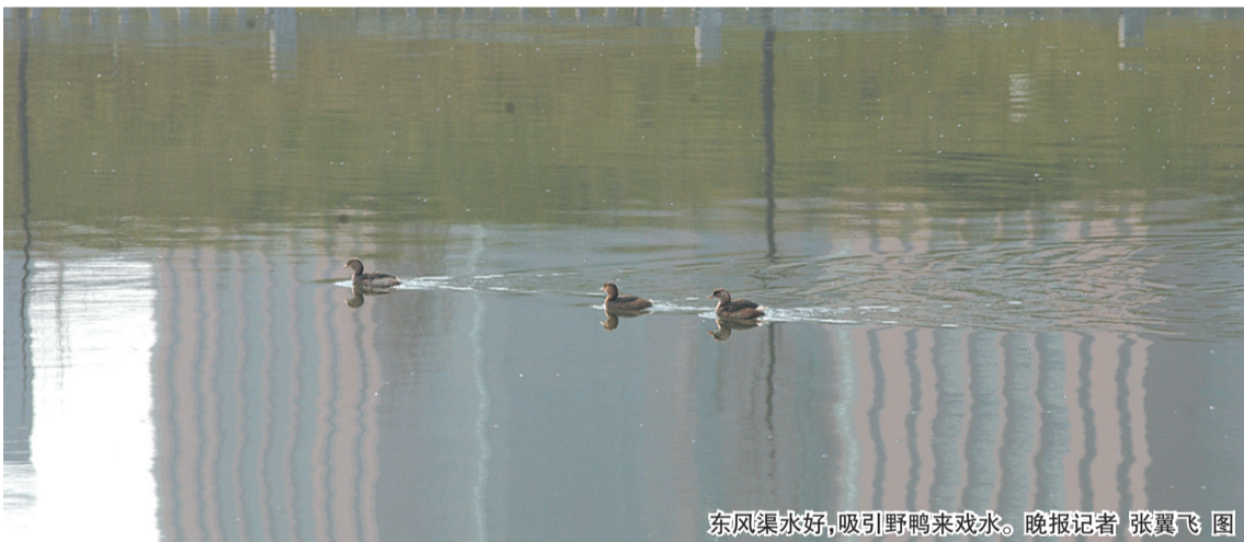
东风渠水好,吸引野鸭来戏水。