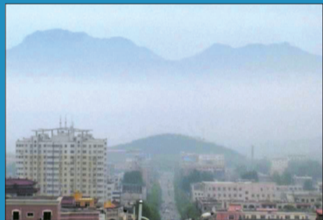
5月8日11时30分,登封市区南出现“海市蜃楼”。淡淡云层上,山色如黛,绵延十余里。据登封电视台视频截图,故有些模糊

LUXURY PALACE THE PEARL CAN BECOME THE BEAST CAN NEVER END