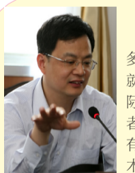
上海瑞金医院烧伤中心主任 张勤教授

这几年,郑州市第一人民医院变化非常大,从规模、专业技术队伍、科室设置、医疗设备看,今天的市一院都是一个综合性的集医疗、科研、教学、康复、保健为一体的三级医院。该院的烧伤队伍也在不断的壮大发展,人才包括硕士生、博士生,烧伤科的实验室、科研成果层出不穷,每一年的科研鉴定也是最多的。所以,我认为郑州市第一人民医院对河南省的烧伤队伍建设、发展起了一个标兵带头作用。郑州市第一人民医院是河南省烧伤界培训基地、教学基地、培养基地,不愧为河南省烧伤的网络救治中心。