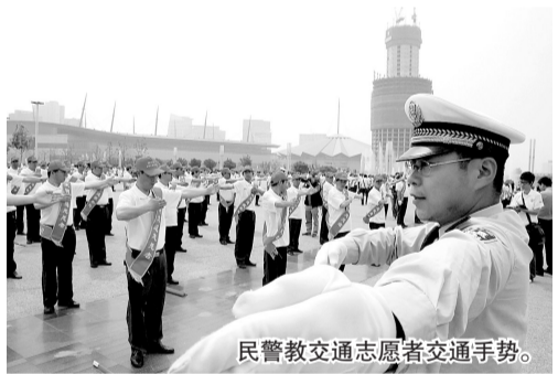
民警教交通志愿者交通手势。