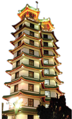
□晚报记者 祁京 通讯员 张娇 柳雨/文

2008年5月,郑州市政府开通“移动OA”项目,市政公务人员可实时、快速、方便、高效的进行移动办公。该项目涵盖公文流转、日程安排、会议活动、领导批示等功能,当政府官员或政府公务员到外地出差时,可实时接收文件或邮件到达通知,并通过EGPRS网络快速阅办公文,甚至在高速移动中同样自如办公,真正实现“网络随身,信息尽在掌控”。