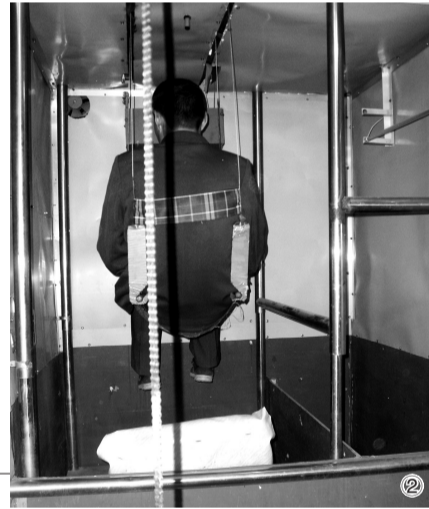
利用滑道滑向浴池上方