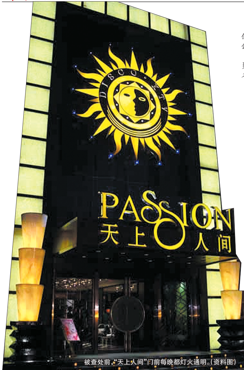
被查处前，“天上人间”门前每晚都灯火通明。(资料图)

13日，北京警方通报，自4月11日起，北京警方开展了打击卖淫嫖娼专项行动，149个卖淫嫖娼团伙被打掉，256家招嫖发廊被取缔，1132名违法人员，被处以治安拘留及以上处理。包括天上人间夜总会、旺世豪门商务会馆等35家娱乐场所，因存在有偿陪侍、消防隐患或涉黄被停业整顿或关停。