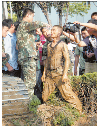
从管道里出来,消防队员全身糊满了泥。