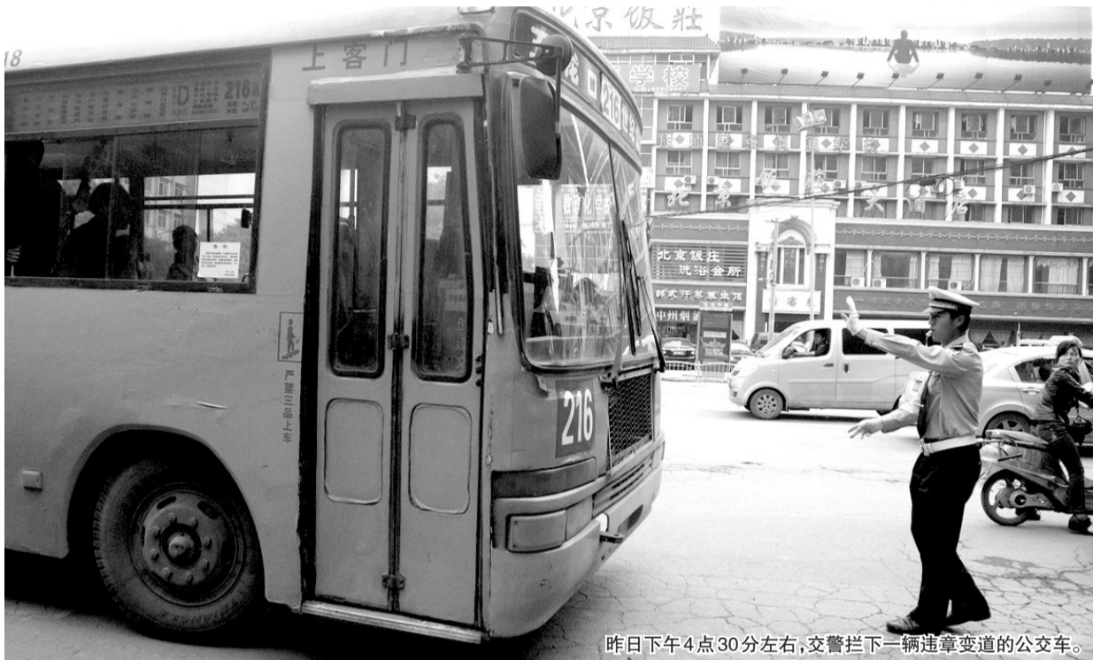
昨日下午4点30分左右,交警拦下一辆违章变道的公交车。

昨日,共发现和处罚公交车、出租车违章60多例,主要是出租车借道闯红灯,压实线超车和公交车不靠站停车上下客、变更车道。 晚报记者 孙庆辉 孙娟 实习生 刘李/文