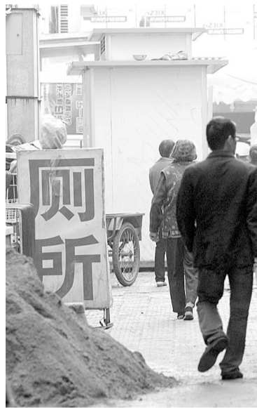
二七广场附近一胡同内,竖立着“厕所”的广告牌。