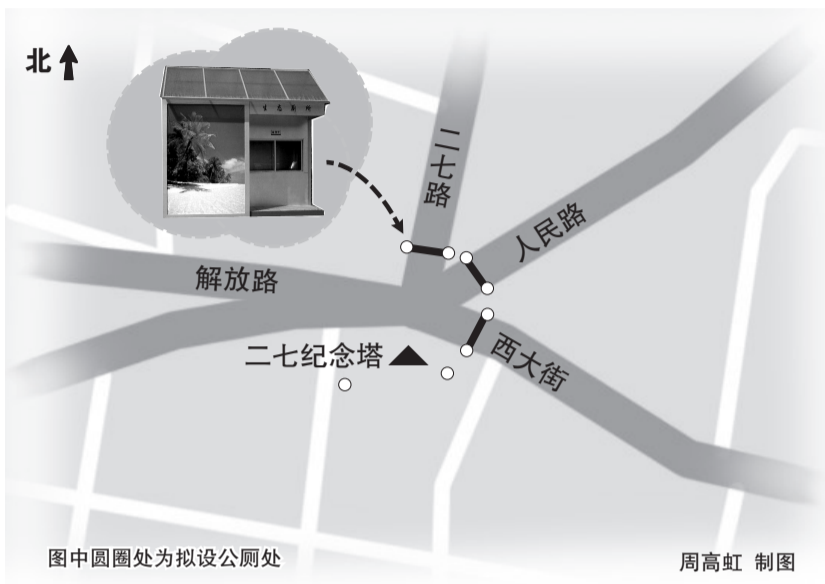
图中圆圈处为拟设公厕处