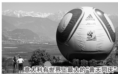
意大利有世界上最大的“普天同庆”

最多的一笔工钱——2300块。然而那个月的工作量也是最大的——娃娃要使用一刀最多可以切出25块球皮的刀模,裁出四五十箱的合格球皮。向娃娃解释“南非世界杯是什么”是个艰难而晦涩的过程。对于一名离异还要负担孩子生活费的母亲而言,从她手下流出去的这些皮革的积极意义在于,“能多赚些钱还是挺开心的……”