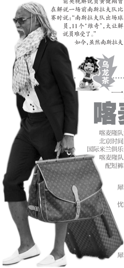
▲宋与犀利哥有几分神似

据悉,除了马桶,阿根廷队的其他要求也不少。比如将房间墙壁染成白色、安装6台游戏机,每天至少要有10道热菜,每顿至少要有14款沙拉、冰淇淋全天候24小时“待命”。