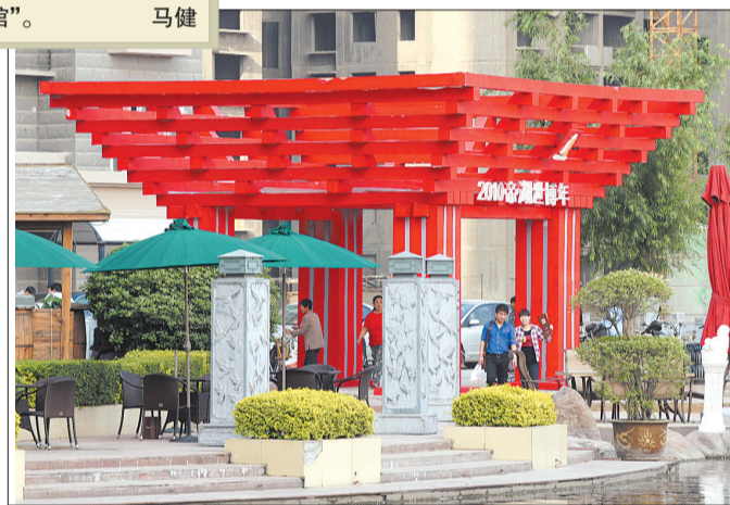
帝湖旁边的“中国馆”。