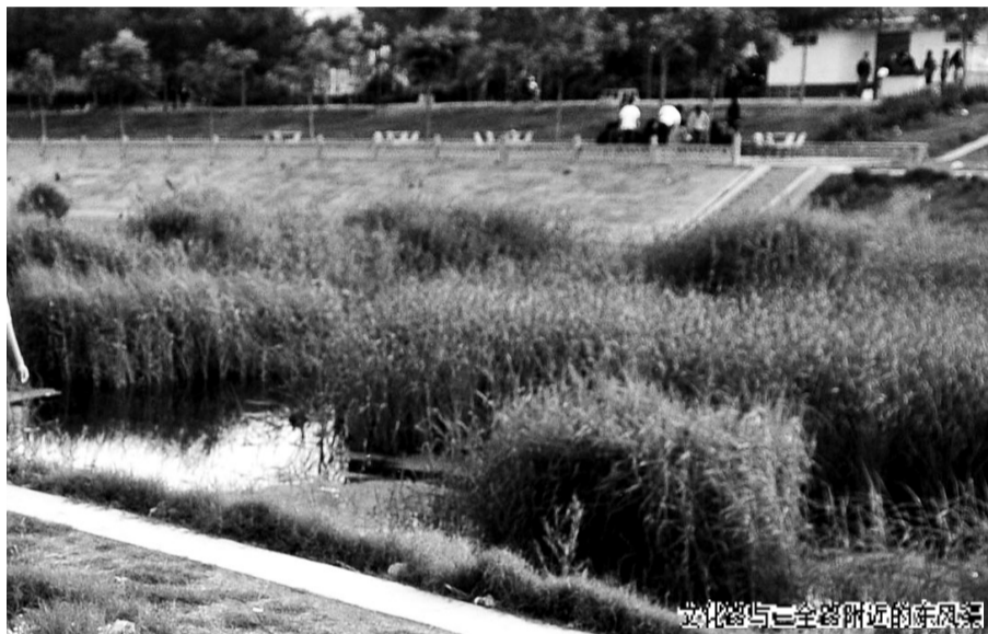
文化宫与三全路附近的东风渠

对此,郑州市城区河道管理处表示,东风渠内出现的水草,与引来的黄河水有很大关系。 晚报记者 汪永森 董洪刚/文