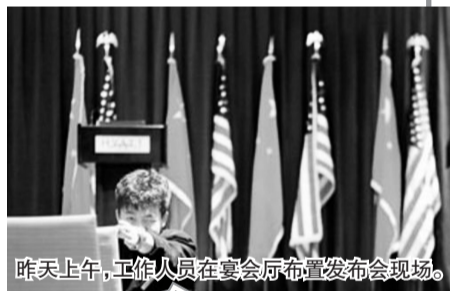
昨天上午,工作人员在宴会厅布置发布会现场。