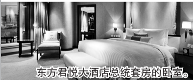
东方君悦大酒店总统套房的卧室。