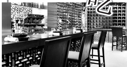
东方君悦大酒店的长安壹号餐厅。

据了解,由于会议行程太紧凑,美方代表团很少留在酒店用餐,目前还没机会品尝酒店这一招牌菜。