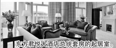
东方君悦大酒店总统套房的起居室。

此外,工作人员为参加发布会的记者准备了100把椅子,而记者席和嘉宾席以不同颜色的椅子来区分。