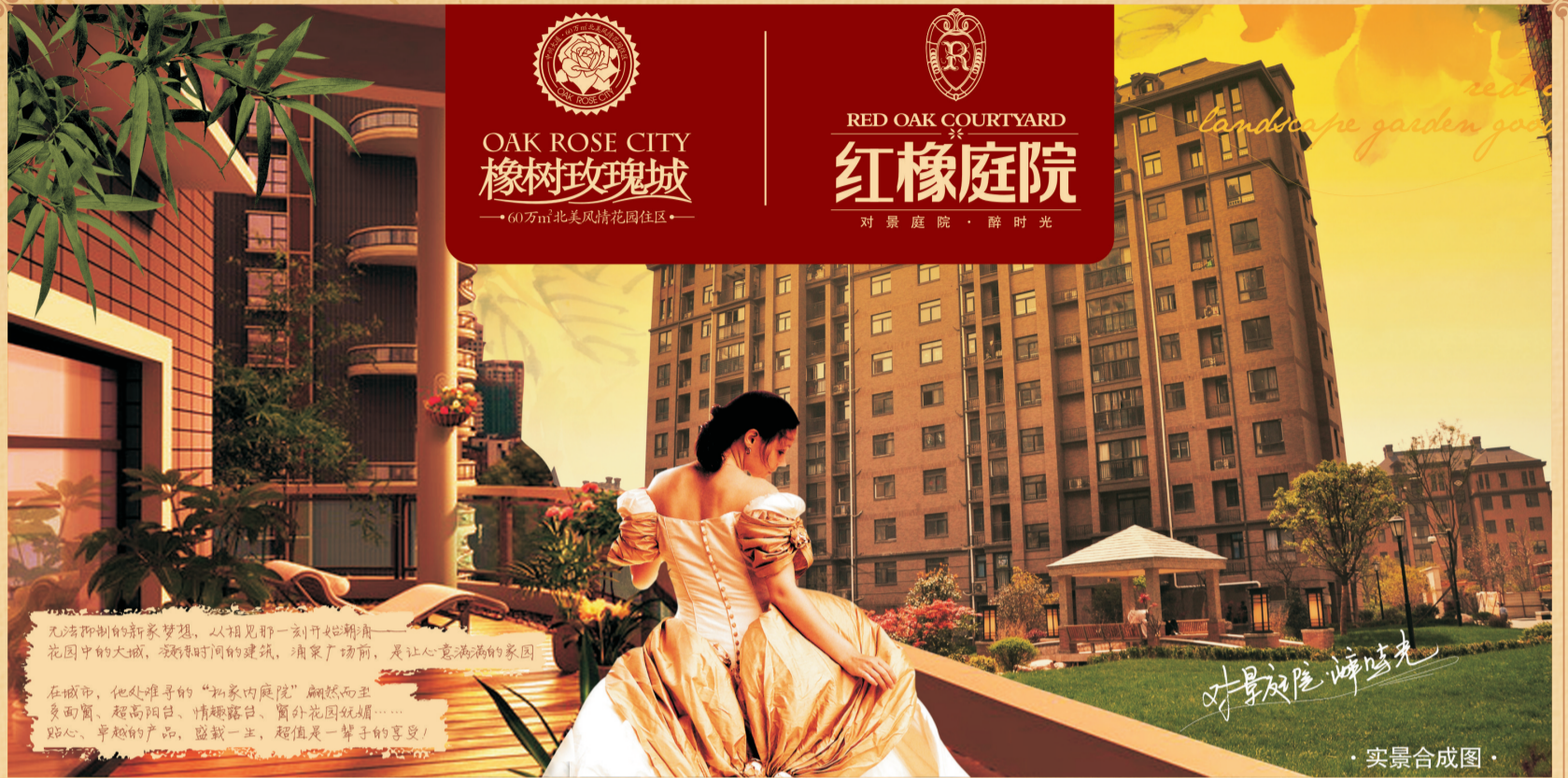
· 实景合成图 ·