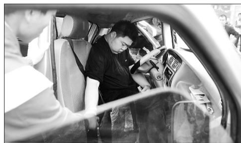
昨日，在车祸现场，大家解救被困司机。