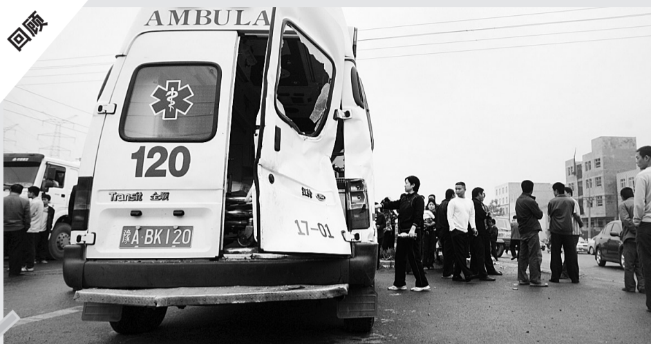
5月16日，这里发生连环车祸，120救援人员被撞。

昨天，这里又发生车祸 一辆面包车被撞飞30米 10天前，在一起车祸中 一名120急救员被撞身亡