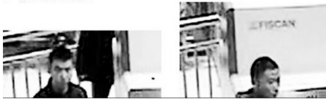
洛阳警方发布的“网络通缉令”(网络截图)