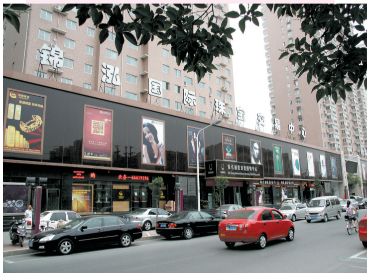
锦泓国际珠宝优惠大幕将开启