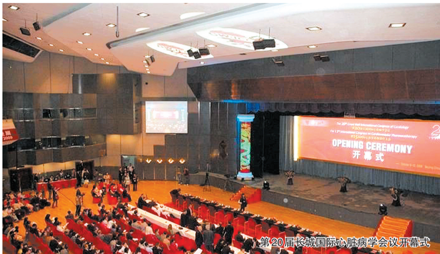
第20届长城国际心脏病学会议开幕式

1.在诊断上，通过望、闻、问、切四法，进行严谨的阴、阳、表、里、寒、热、虚、实等八纲辨证，给每位患者精确分型。