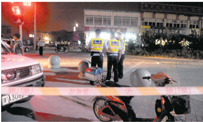
超市四周比较空旷,没有制高点。