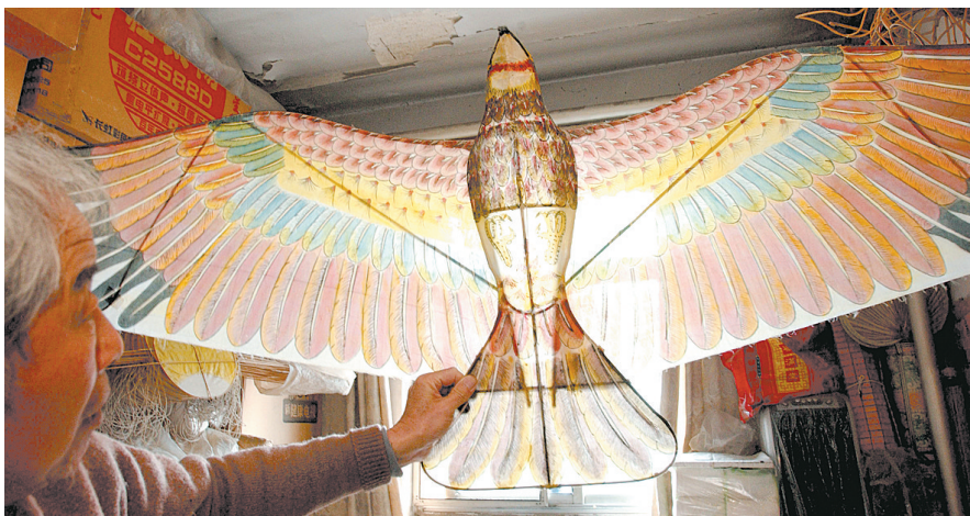
老人展示自己制作的鸢鹰风筝。阳光打进来，煞是好看。