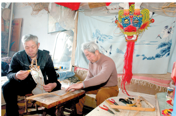
两位老人在一起探讨制作风筝的技巧。