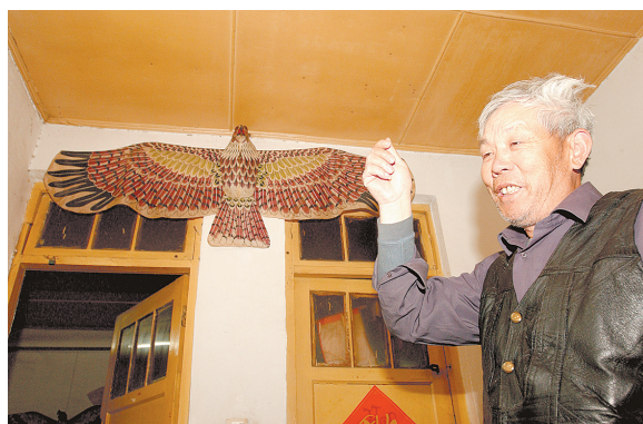
老人介绍：有一次，放飞鸢鹰风筝，曾经有真的老鹰围着风筝盘旋，以为发现了同类。