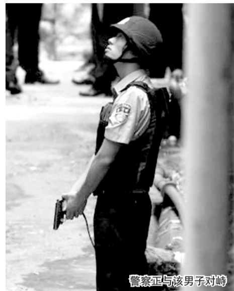
警察正与该男子对峙

昨天上午10点多,一名男子在广州白云区京溪街银兴路一住宅楼内与警察对峙。他开枪打伤一名警察后,于昨晚8点左右被警方击毙。