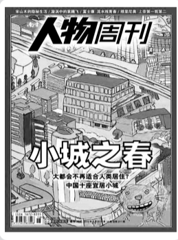
《南方人物周刊》2010年第18期

面对一线城市过于激烈的社会竞争及过大的生活压力，移居到其他更宜居的中小城市或许是一种很不错的选择。但是，在我们的整个社会状况得到根本性改变之前，生活压力损害年轻人身心健康的情况其实无处不在。