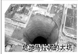
危地马拉城的大坑