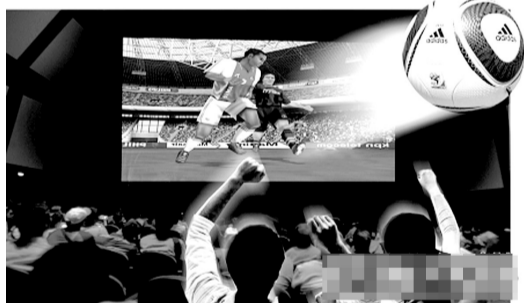
电影院看3D世界杯最时尚

是为了个人的名利。而对于中国球迷来说,虽然没有中国队参与,但世界杯的欣赏价值,或者说珍藏价值是实实在在的。毕竟,四年才一届。足球明星的职业青春很短,在今天这个舞台上,90后球迷们看到的是C罗,是梅西,但对于80后的人来说,最初喜欢的那批球星已经渐行渐远了,比如罗纳尔多、罗纳尔迪尼奥等。对他们来说,看一场就少一场,所以才会倍加珍惜。