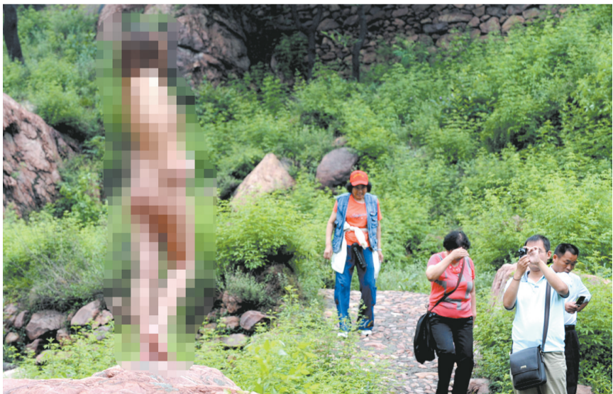
游客从旁边经过，一位大妈不敢抬头看。

Fast-Back 英伦风秀曲线 1379L 动态优化空间 50:50 首尾谐一稳定车身