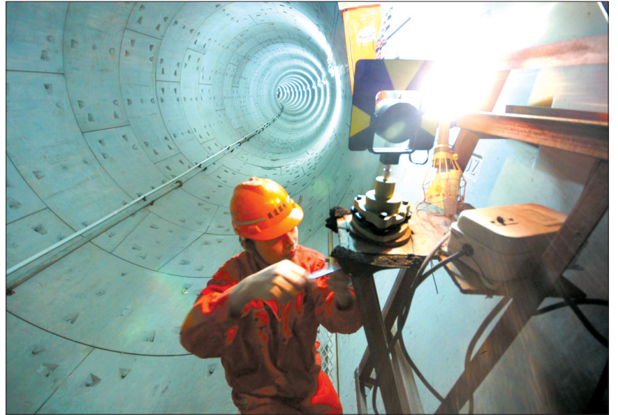
▲技术人员在测量数据，对已经完工的隧道进行维护管理，几个月后，隧道才能进入稳定期。