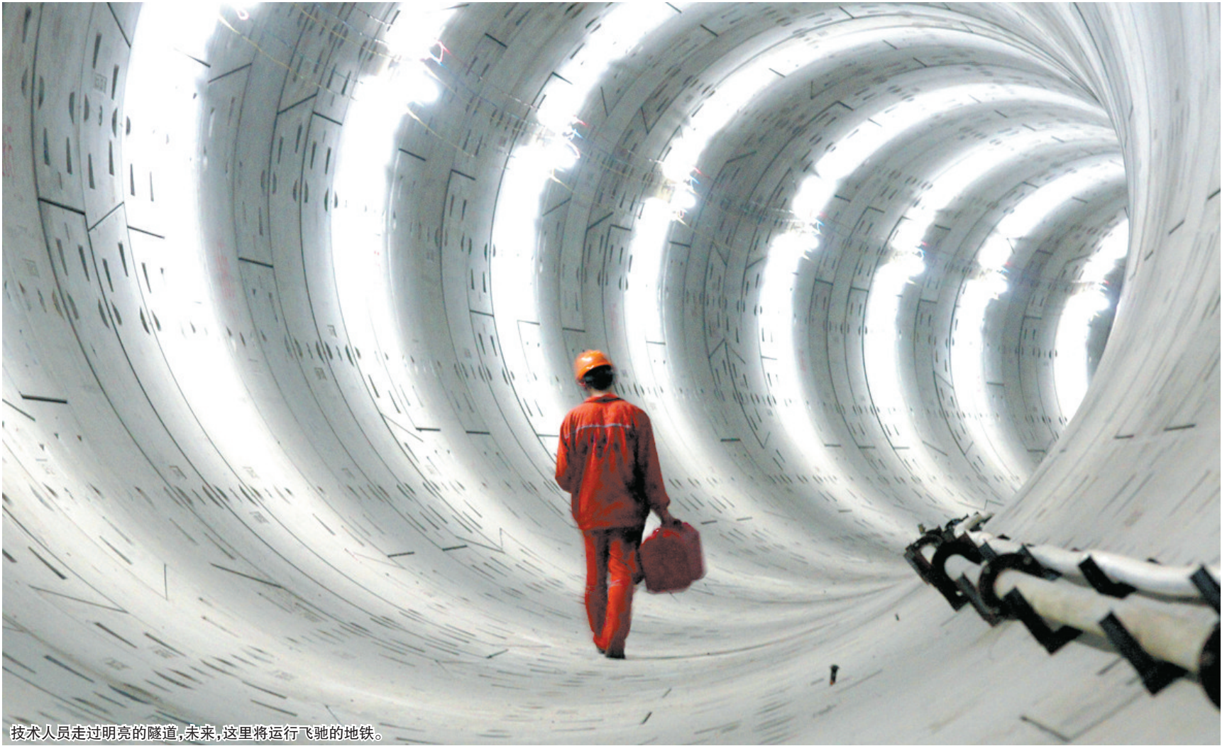
技术人员走过明亮的隧道，未来，这里将运行飞驰的地铁。