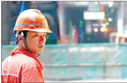
►建设 地铁的新“地 下工作者”。