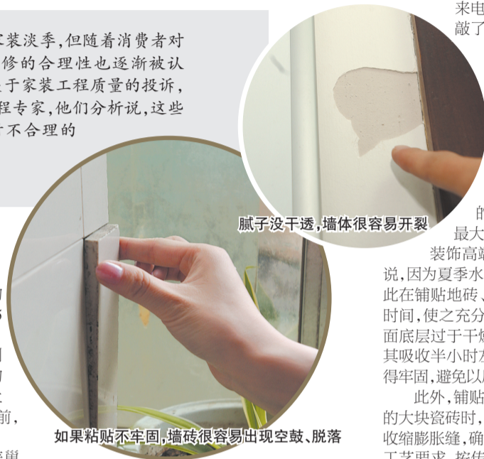
腻子没干透，墙体很容易开裂