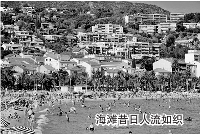
海滩昔日人流如织