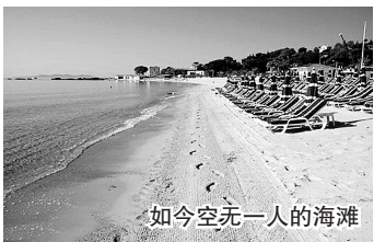
如今空无一人的海滩

不过，盖特纳于4月3日宣布，政府推迟公布原定于4月15日发布的主要贸易对象国际经济和汇率政策情况报告。分析人士指出，美国国会今年将举行中期选举，因此不少国会议员将人民币问题政治化，以争取选票。其实人民币汇率问题并非中美贸易失衡的根本原因，中美一旦就此问题爆发冲突，其结果必将是两败俱伤。