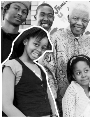
笑容如此灿烂,可惜斯人已逝。

但你还是最想在开幕式上看见那个老人,“全球公民典范”纳尔逊·曼德拉,当初国际足联投票给南非,不如说是投票给了他。世界杯结束后的一个星期,曼德拉就要过第92个生日了。由于痛失曾孙女,他没有来。不过,不管来与不来,开幕式都是他的“贺寿片”。这一夜的盛宴和光芒,不属于贝利,不属于马拉多纳,不属于布拉特,这个夜晚,归于92岁的纳尔逊·曼德拉。