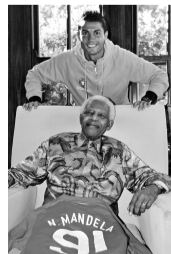
左图:C·罗拜会曼德拉,先送球衣再合影。

当申办成功消息传来,曼德拉在庆祝仪式上说道:“我感觉自己就像个15岁的年轻人。”说这话时,他已经85岁高龄。