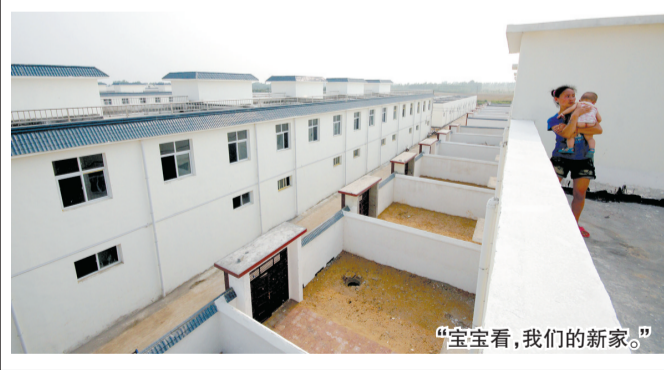
“宝宝看,我们的新家。”