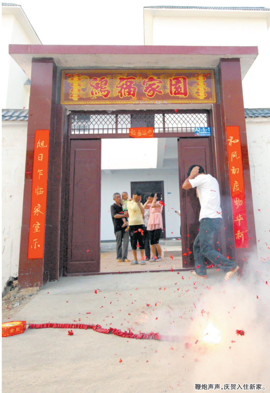
鞭炮声声,庆贺入住新家。