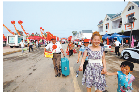
一栋栋楼房、规划整齐的道路、全新的小学……崭新的家,带给了移民无尽的惊喜。