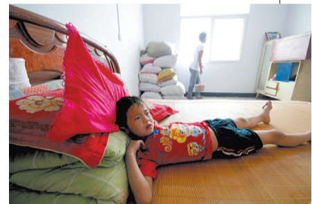
“学校就在俺家对面,俺妈说了,等9月份开学了,俺就该去新学校上学了。”