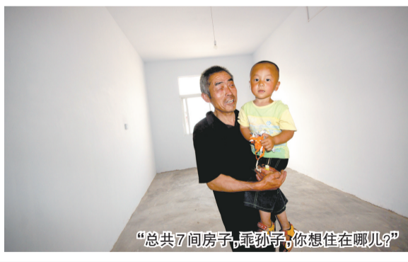
“总共7间房子,乖孙子,你想住在哪儿?”