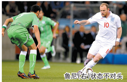
鲁尼(右)状态不对头

在预选赛上表现出众的鲁尼,是现在的这支英格兰队最重要的攻击点。但一旦进入决赛圈,鲁尼往往习惯性地陷入迷失。在曼联队,无论在英超还是欧冠,鲁尼都是一个稳定而高产的射手,进球如麻。但是在鲁尼参加的6场世界杯比赛中,他居然颗粒无收,射正球门的次数更是只有可怜的4次,换言之,每过100多分钟才有一脚射门打在门框范围内。这样的水准显然不是世界级的。