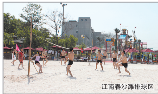
江南春沙滩排球区

“清华·澎湖湾”——家门口的“海湾”，海浪、沙滩、排球应有尽有，2000平方米的大型海啸造浪池，可容纳上千人同时逐浪，亲身体验“海啸”盛况，让您仿佛置身大海怀抱，体验到冲浪的快感！还有各种儿童滑道及儿童戏水池，水滑梯、水蘑菇等多种水上儿童玩具，激发儿童智力，为年龄小的小朋友提供一些简单而可爱的滑梯和喷水设施，让小朋友们在炎炎夏日享受无尽的清凉。