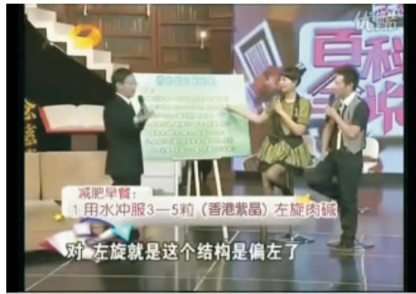
湖南卫视《百科全说》节目现场

2010年3月9日,世界减肥大师西木博士做客南卫视《百科全说》节目,他向观众介绍了一种怪“肉”——左旋肉碱。并称吃此“肉”,无需运动,不腹泻,不厌食,28天即可减重7-15斤,令所有肥胖人士大跌眼镜,随后,吃“肉”减肥法迅速全国蹿红,火爆郑州。