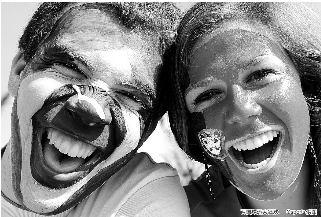
两国球迷狂欢

巴西VS葡萄牙,本是一场万众期待的对决,但球迷翘首以盼的视觉盛宴却像极了残羹冷炙,两队以沉闷平淡的0:0收场,携手晋级16强。小组位次也已经落定,巴西以2胜1平占据小组首位,葡萄牙1胜2平排在第二。