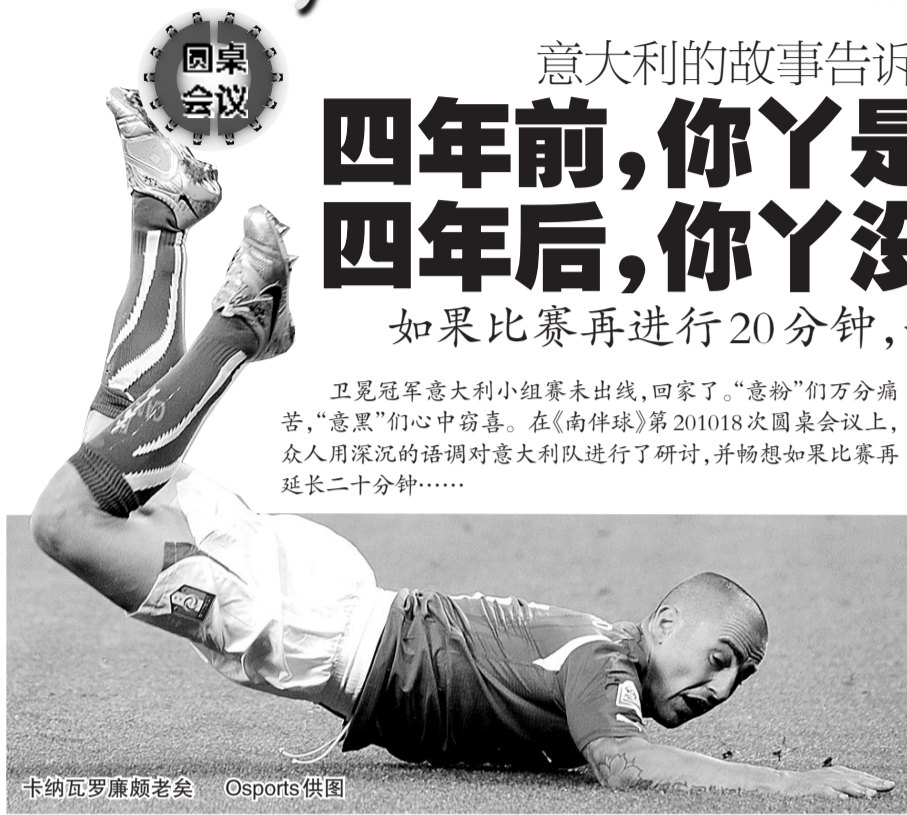
卡纳瓦罗廉颇老矣