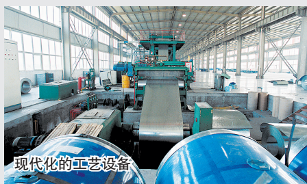
现代化的工艺设备