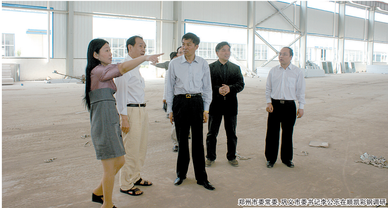
郑州市委常委、巩义市委书记李公乐在顺凯彩钢调研