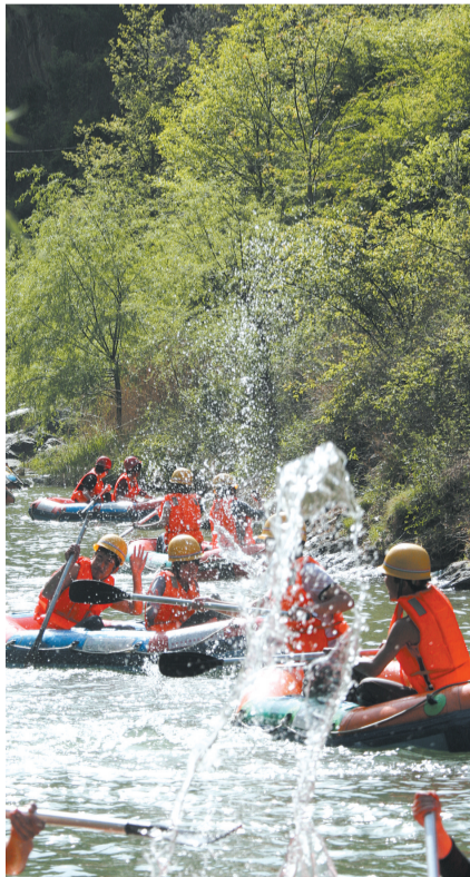
急流险滩随处可见

带孩子漂流探险,就来豫西大峡谷体验“中原第一勇士漂”吧!各大旅行社均可报名。 张莉