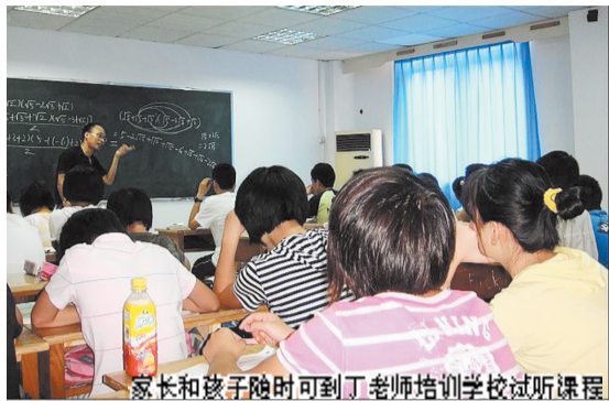
家长和孩子随时可到丁老师培训学校试听课程

每年暑期都有一部分新生“最难过”,尤其是新初一、新高一的新生,面临着心理、生活及学习等方面的变化,学生容易产生一种焦虑情绪。如果在暑期里,家长不做好工作,学生没有做好充足准备,就会对以后的学习造成严重的影响。丁老师文化培训学校经过10多年教学研究,总结了一套针对新生的教学方法与技巧,能让他们在暑期里轻松度过“衔接综合征”。据悉,凡预约前来听课的家长和学生,均可免费听随堂课。