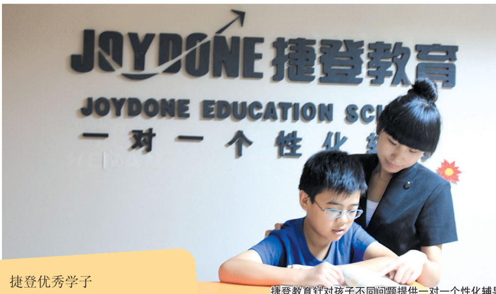
捷登教育针对孩子不同问题提供一对一个性化辅导