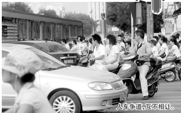
人车争道,互不相让。

文化路农业路口:人车争道 时间:昨日傍晚6点30分 我们的倡议:人和车都要让一让