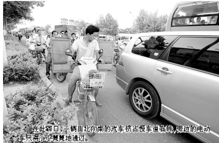
在此路口,一辆由北向南的汽车挤占慢车道右转,旁边的电动自行车只好小心翼翼地通过。

还是这个路口,大量的自行车和行人超出停车线10米左右,见缝插针地过马路,一辆辆汽车几乎贴着自行车车轮驶过,无奈只能放慢速度。同时,超过停车线的自行车又占用了由北向南的右转车辆的道路,无法右转的车辆只好挤占慢车道,强行右转,造成交通混乱。