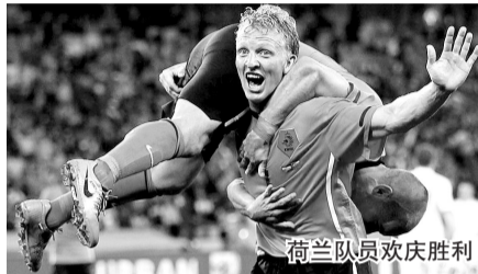
荷兰队员欢庆胜利

如果荷兰也开始打功利足球,我们该怎样纪念那失去的华丽?如果巴西也放弃了桑巴,还有谁能将激情澎湃的拉丁舞起来?不再“水银泻地”的荷兰头一次在世界杯上豪取四连胜,放弃花哨动作的巴西变成了无懈可击的机器。当功利至上,华丽不再,我们喧嚣的年代是否还允许唯美和理想的存在?在《南伴球》第201021次圆桌会议上,众人无语凝噎。