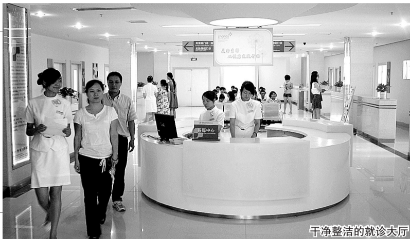
干净整洁的就诊大厅

据悉,此次活动历时1月有余(5月20日),广受中原皮肤病患者关注,报名参与者络绎不绝。活动方负责人说:“这次活动出现过敏原场面火爆,皮肤健疗、中药药浴遇冷,‘一冷一热’两重天的现象。” 董亚飞 蒋晓蕾/文 赵楠/图