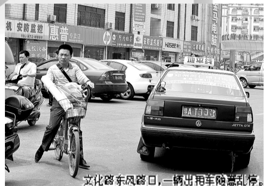
文化路东风路口,一辆出租车随意乱停。