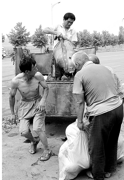
村民争着买瓜,帮瓜农筹钱看病