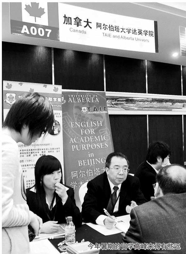
今年暑期的留学高峰来得有些迟