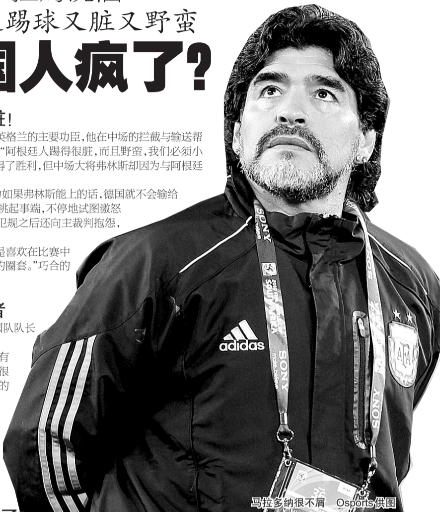
马拉多纳很不屑

几乎是在第一时间,阿根廷媒体就找到了马拉多纳。老马对于两位后辈的指责非常愤怒,“这是我听到过的最荒唐的事情。阿根廷队野蛮?好吧,到比赛时再看看吧,结果会说明一切。”老马知道德国人在打心理战。不过,马拉多纳毕竟见多识广,对他来说这只是小儿科,“如果德国人想用这个来影响我们,那他们肯定是发疯了。”