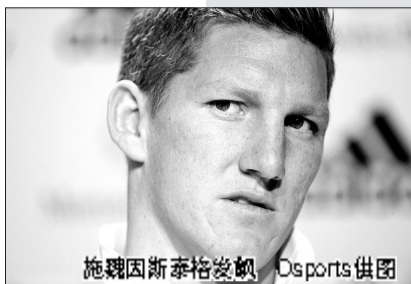
施魏因斯泰格