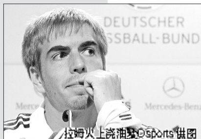
拉姆火上浇油

正所谓仇人见面,分外眼红。德国队和阿根廷队是一对冤家,在1986年和1990年,两队连续两届世界杯会师决赛,各胜一场的战绩让双方结下了梁子。4年前的德国世界杯上,德国与阿根廷也是在四分之一决赛中相遇,马拉多纳以球迷身份观看了比赛,双方120分钟打成1:1后,德国队经过点球大战以5:3取胜。不过,赛后双方发生争执和斗殴。